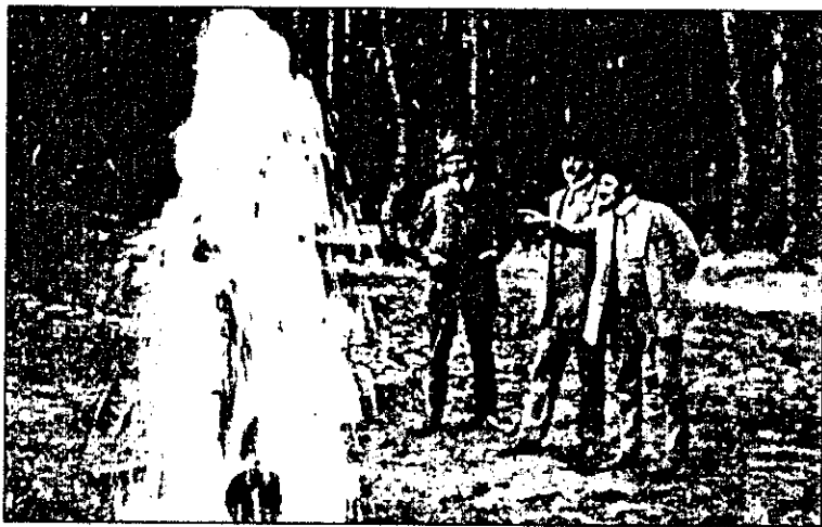
Vývěr artéské vody v Káraném v roce 1909

Co znamenala Káranská vodárna pro Prahu a předměstí v dobách války, pochopilo veškeré obyvatelstvo po přivedení vody do pražských vodojemů. V dobách epidemií, všeobecného nedostatku, kdy civilní obyvatelstvo postrádalo výživu